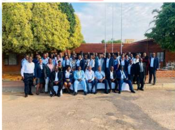
Prezydium IPA Botswana

Kongres odbył się w przyjaznej i braterskiej atmosferze, a także zgodnie z zasadami naszego Stowarzyszenia. W procedurze wyborczej uczestniczyli delegaci z czterech regionów naszej Sekcji. Konferencję uświetniły Sekcje Eswatini i Lesotho. Ponadto Kongres miał charakter wyborczy, a delegaci głosowali nad wyborem członków Prezydium Sekcji Krajowej.