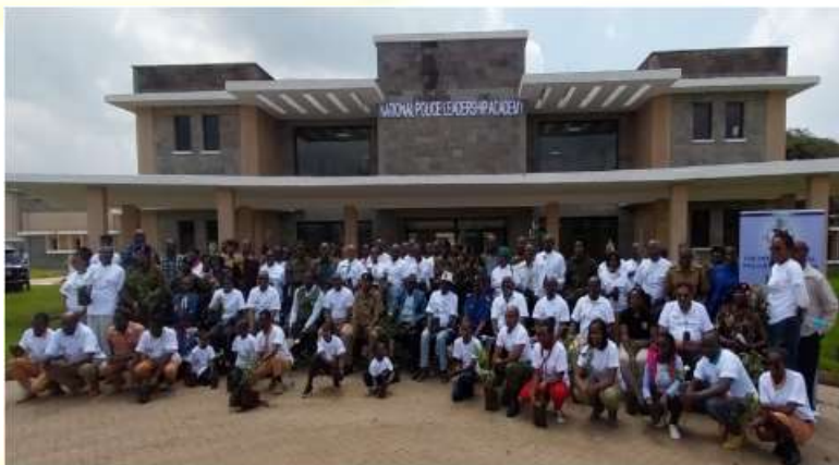
Członkowie IPA Kenia zbierają się w NPLA w celu sadzenia drzew

Członkowie Międzynarodowego Stowarzyszenia Policji (IPA) Sekcja Kenia zebrali się w Akademii Policji (NPLA) w Ngong w dniu 5 maja 2023 r. na doroczne sadzenie drzew, podczas którego zasadzono 3 200 sadzonek. Ćwiczenie jest odpowiedzią na wezwanie Jego Ekscelencji Prezydenta do osiągnięcia celu posadzenia 15 miliardów drzew w całym kraju, aby przywrócić utraconą pokrywę leśną kraju. Program ma na celu złagodzenie niszczycielskich skutków zmian klimatycznych.