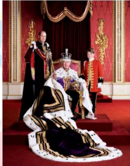
Król Karol III z księciem Williamem (po lewej) i księciem Jerzym (po prawej)

Aby uczcić tę okazję, historyczny moment był transmitowany w telewizji i wiele osób podróżowało do stolicy, wychodząc na ulice, aby rzucić okiem na nowo koronowanego Króla. Wiele innych wydarzeń i uroczystości odbyło się w całej Wielkiej Brytanii, takich jak uroczyste obiady koronacyjne i tysiące imprez ulicznych.