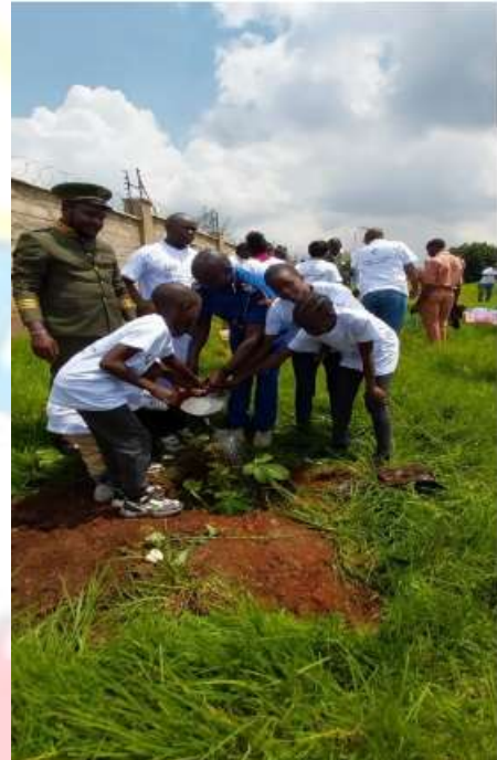
Dzieci dołączają do Komendanta w podlewaniu sadzonki