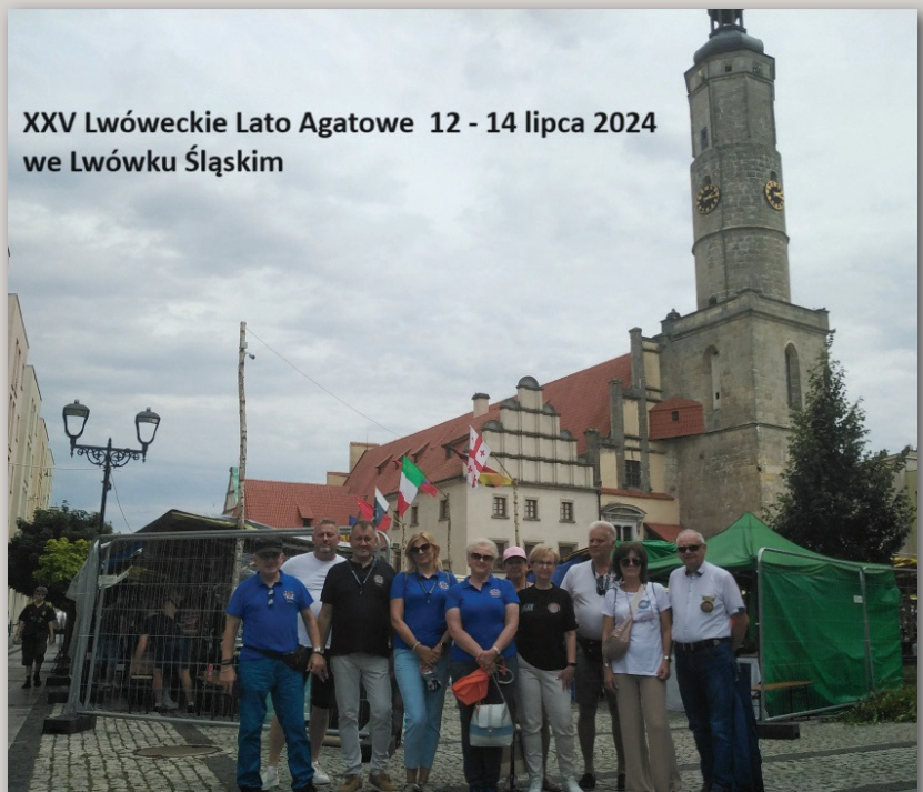
XXV Lwóweckie Lato Agatowe 12 - 14 lipca 2024 we Lwówku Śląskim